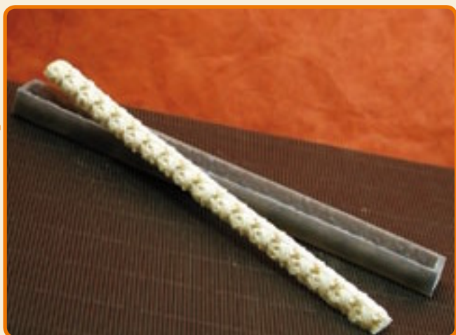
Decoro 1 modanatura classica