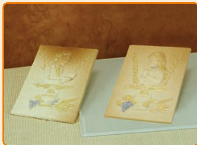
Pergamena in rilievo Bimbo