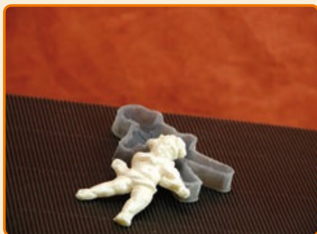
Decoro 6 putto con violino