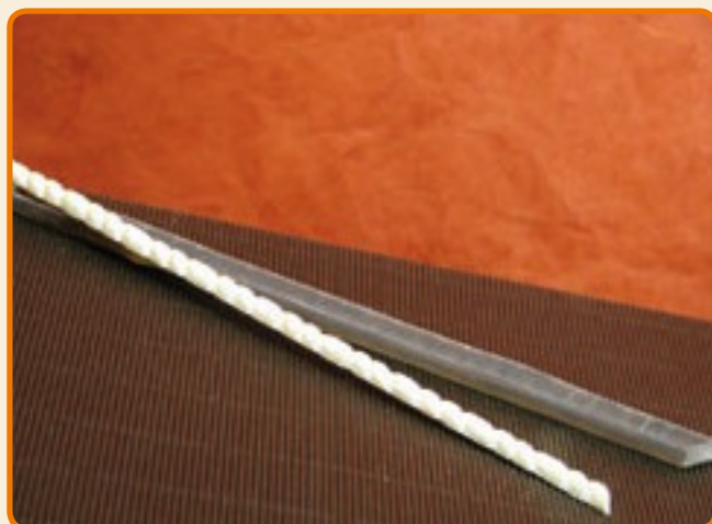
Decoro 4 torciglione grande