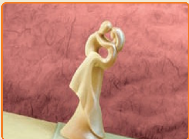
Sposi Stilizzati tra le braccia cod. 3019

Tipo di stampo: a 2 facce Dimensioni del soggetto: b cm 7,5 x h cm 25 x p cm 6,5 n° soggetti per ogni stampo: 1