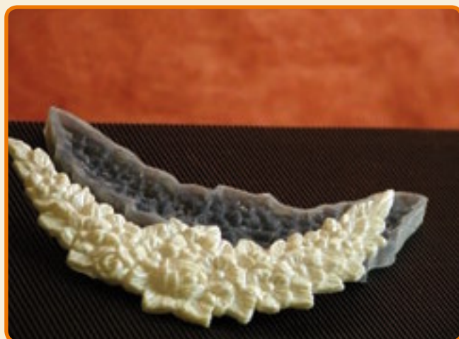
Decoro 10 floreale medio