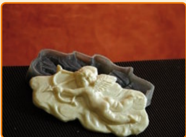
Decoro 9 cupido