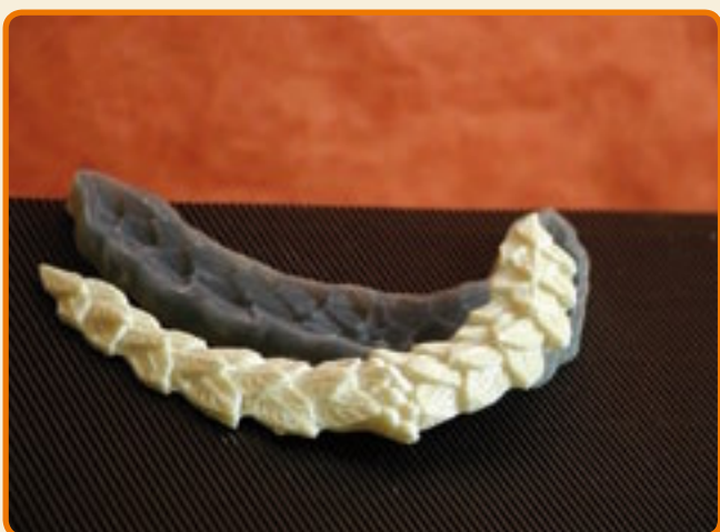
Decoro 11 con foglie