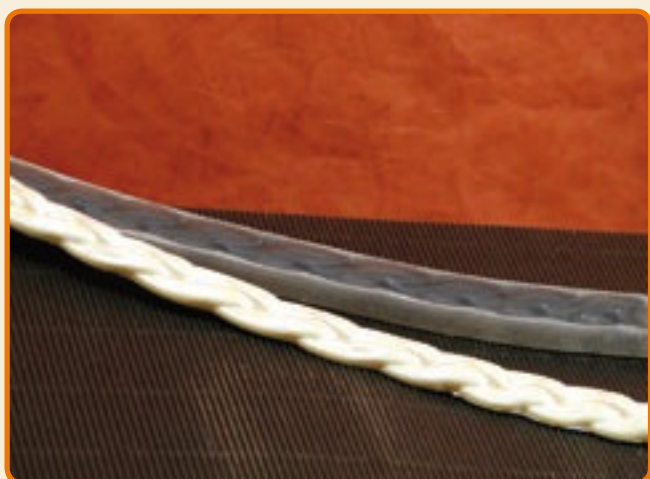
Decoro 5 treccia