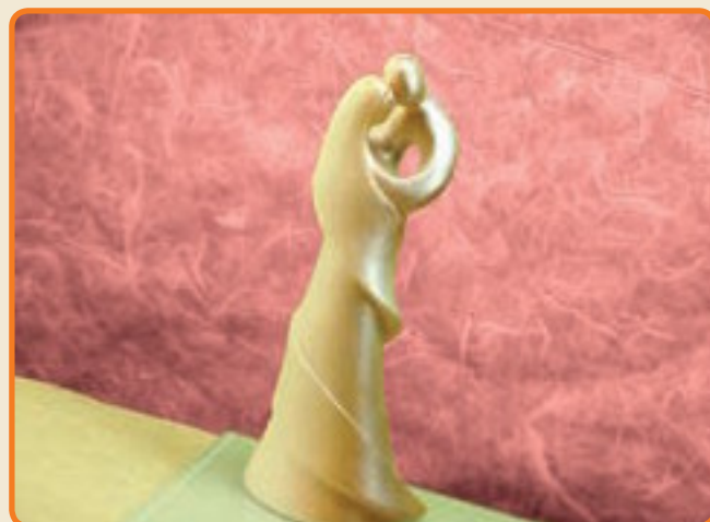
Sposi Stilizzati abbraccio cod. 3020

Tipo di stampo: a 2 facce Dimensioni del soggetto: b cm 7,5 x h cm 25 x p cm 6,5 n° soggetti per ogni stampo: 1