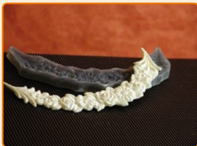
Decoro 12 floreale piccolo