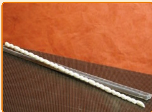
Decoro 2 torciglione piccolo