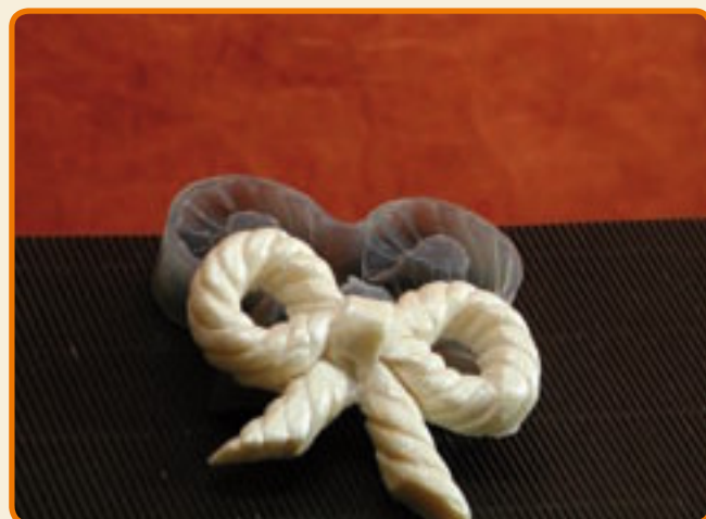
Decoro 22 fiocco

Tipo di stampo: a 1 faccia Dimensioni del soggetto: b cm 19,2 x h cm 7 x p cm 0,5 n° soggetti per ogni stampo: 1