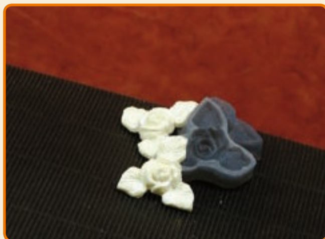
Decoro 8 roselline kit n° 2 pezzi