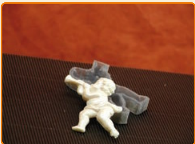
Decoro 7 putto con flauto