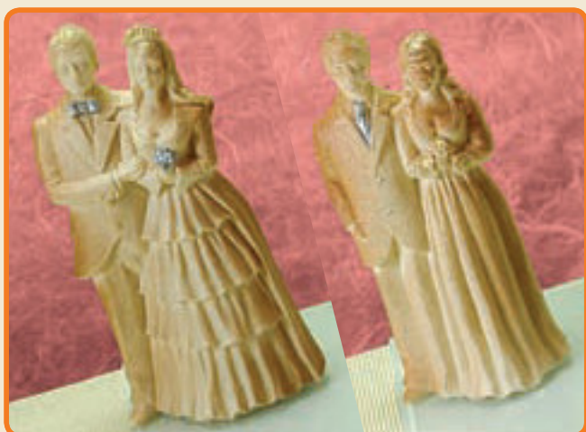
Sposi Grandi / Medi cod. 3001 / 3002

Tipo di stampo: a 2 facce Dimensioni del soggetto: b cm 7,5 x h cm 21 x p cm 5 n° soggetti per ogni stampo: 1