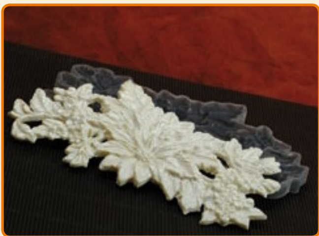
Decoro 13 floreale grande