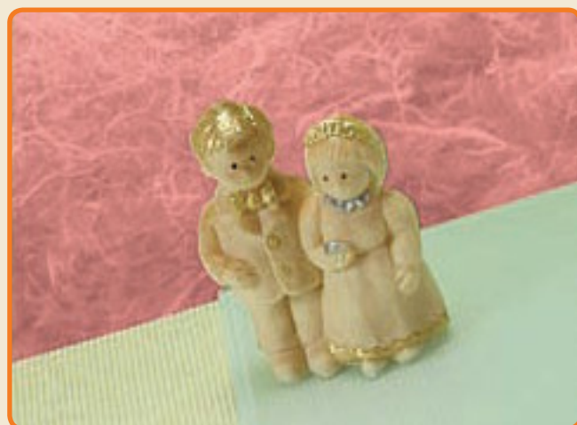
Sposini cod. 17004

Tipo di stampo: a 2 facce Dimensioni del soggetto 1: b cm 13 x h cm 26 x p cm 8 Dimensioni del soggetto 2: b cm 8 x h cm 18 x p cm 5 n° soggetti per ogni stampo: 1