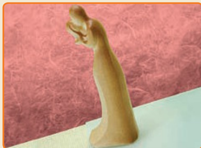
Sposi Stilizzati cod. 3003

Tipo di stampo: a 2 facce Dimensioni del soggetto: b cm 6,5 x h cm 20,5 x p cm 6,2 n° soggetti per ogni stampo: 1