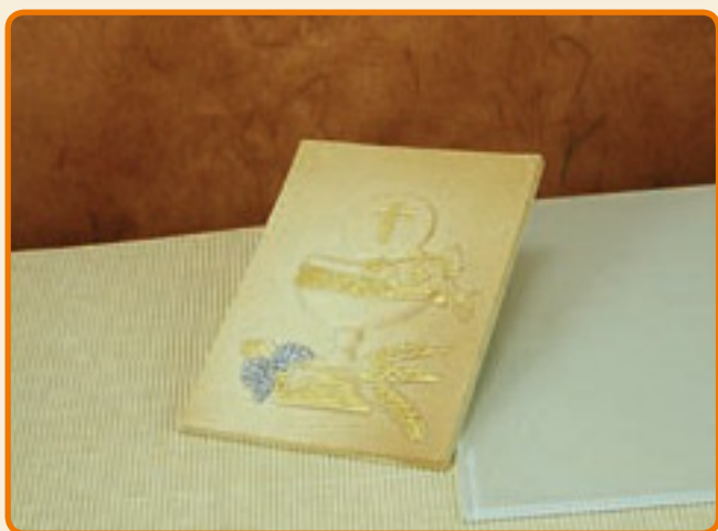
Pergamena in rilievo Coppa Comunione