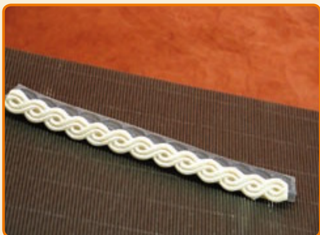
Decoro 3 greca