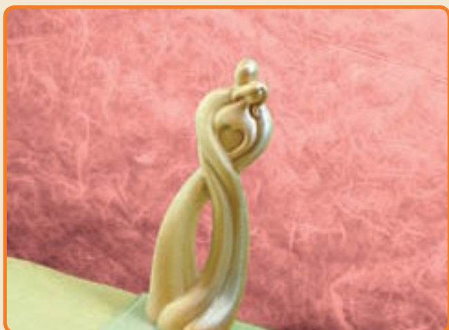
Sposi Stilizzati cuore cod. 3021

Tipo di stampo: a 2 facce Dimensioni del soggetto: b cm 8,3 x h cm 20,5 x p cm 7,1 n° di soggetti per ogni stampo: 1